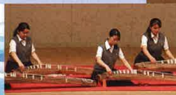
琴部 全国大会出場！