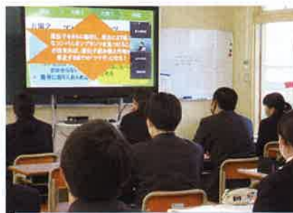
OGR (Ogori Global Research) プロジェクト 探究活動