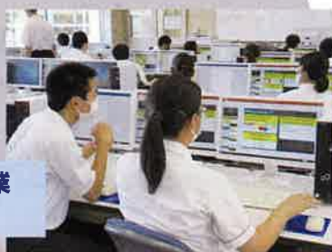
英語イマージョン授業 (情報)