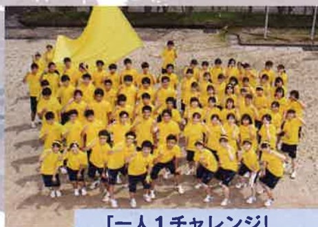
「一人1チャレンジ」 失敗から学び、考え抜く