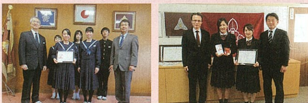
県立香椎高等学校