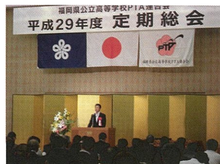
来賓として挨拶をする本会理事長