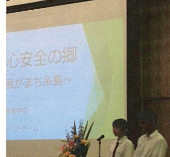
筑前高校研究発表の様子