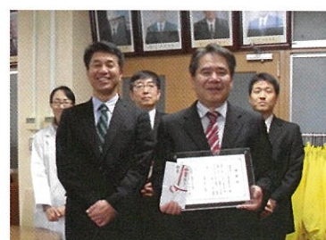
県立八女工業高等学校